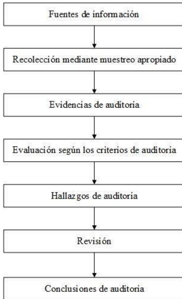
Figura 2 - Descripción de un proceso típico de recopilación y verificación de información Los métodos de recopilación de información incluyen, entre otros, los siguientes:

La Figura 2 proporciona una visión general de un proceso típico, desde la recopilación de información hasta llegar a conclusiones de auditoría.